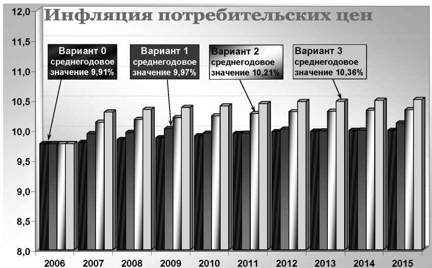
Рис. 1. Прогноз инфляции потребительских цен, в процентах к предыдущему году

* Вариант «0» — объем инвестиций сохраняется на имеющемся уровне, вариант «1» — дополнительно инвестируется 20 млрд долл. в год, вариант «2» — 40 млрд долл. в год, вариант «3» — 60 млрд долл. в год